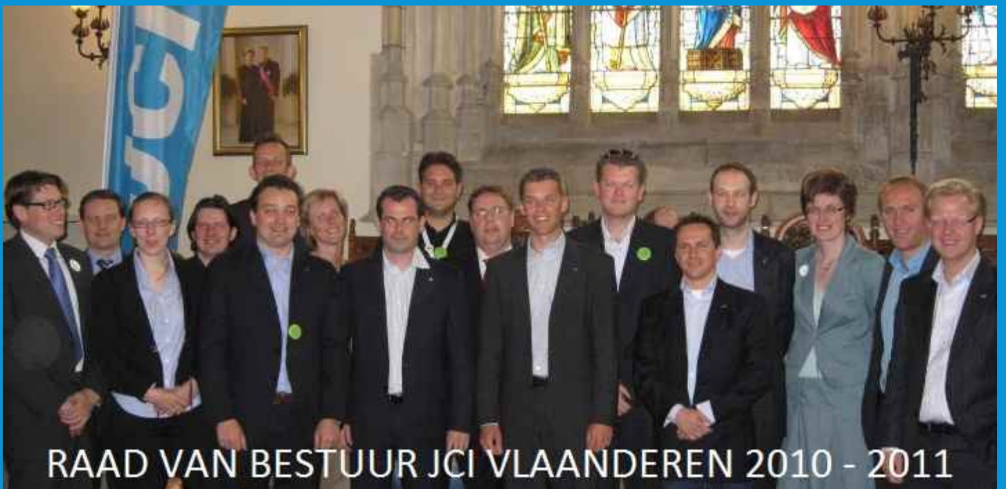
RAAD VAN BESTUUR JCI VLAANDEREN 2010 - 2011

JCI Dag van de Verantwoordelijken 28 08 2010